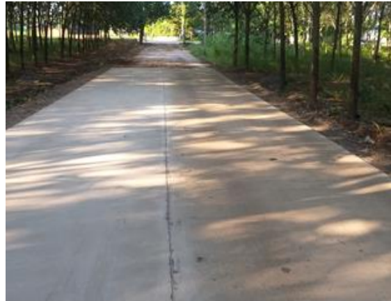
โครงการปรับปรุงถนนลาดยางแอสฟัลต์ติกคอนกรีตบ้านเตาอิฐ-บ้านไทยเดิม-บ้านมอกระหาด (สายภูหินสวาย-ถ้ำโพธิ์ทอง)