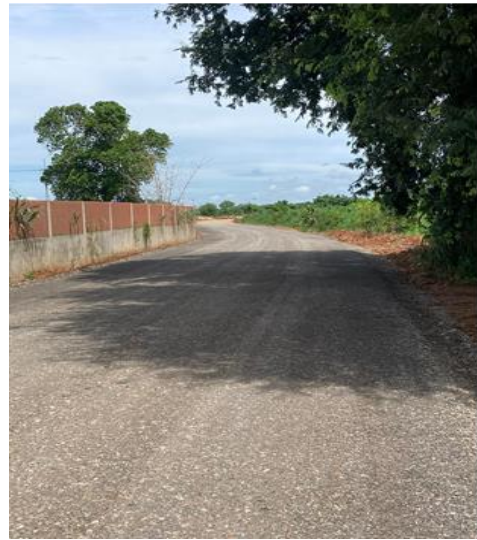
โครงการปรับปรุงไหล่ถนน สายหนองครก-คลองส่งน้ำ