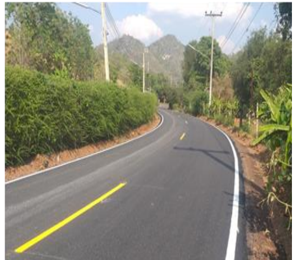
โครงการปรับปรุงถนนลาดยางแอสฟัลต์คอนกรีต สายซอยบ้านลุงบัว