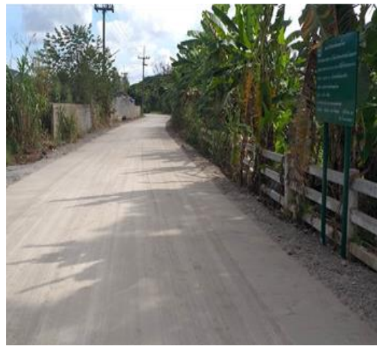
โครงการปรับปรุงถนน สายหลังเขา (ช่วง กม.9 ธาระรัต)