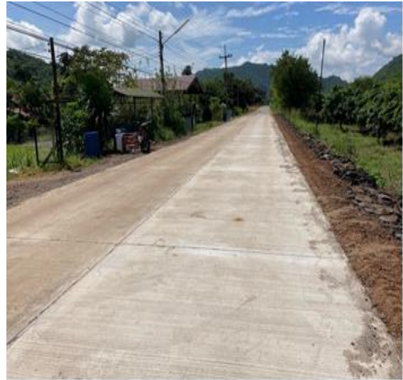
โครงการก่อสร้างถนนคอนกรีตเสริมเหล็ก สายหมอแดง (ช่วงโครงการ1.618)