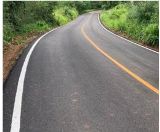
โครงการปรับปรุงถนนลาดยางแอสฟัลต์คอนกรีต สายเขาแคบ