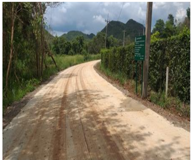
โครงการก่อสร้างถนนคอนกรีตเสริมเหล็ก สายหมอแดง (ช่วงมอเตอร์เวย์)