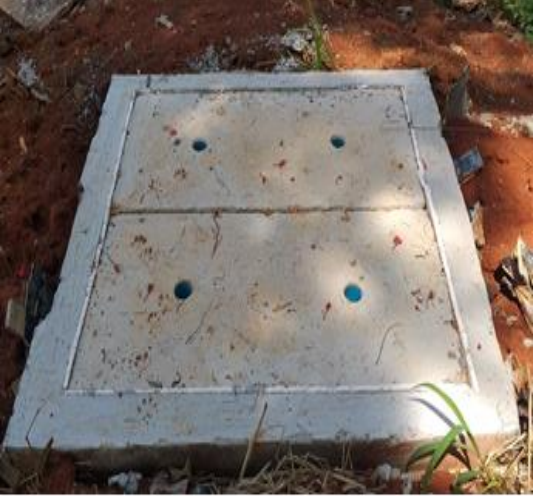
โครงการขุดเจาะบ่อบาดาล กลุ่มบ้านนางหรั่ง