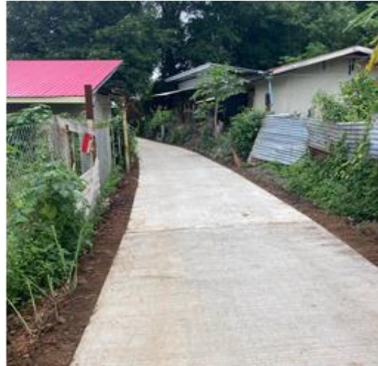
โครงการปรับปรุงถนนลาดยางแอสฟัลท์ติกคอนกรีต สายเขาแหลม