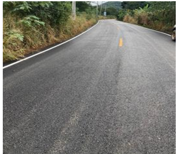
โครงการปรับปรุงถนนลาดยางแอสฟัลต์คอนกรีต สายหลัก ภูหินสวาย (บุญโต)